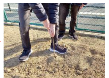
選手交代・・・これむりです!