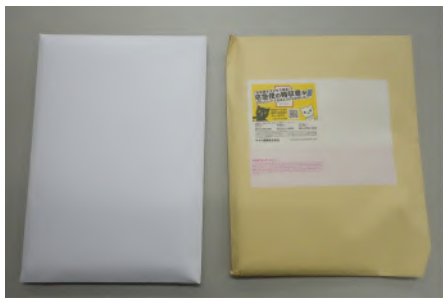
なんか思ってたのと違っ...

ネットで買ったのでこの形で送られてくるのは当たり前なのですが、これを見せたときのメンバーたちのなんともいえないがっかりとした雰囲気です。気が取り直して封筒を開けてみると、