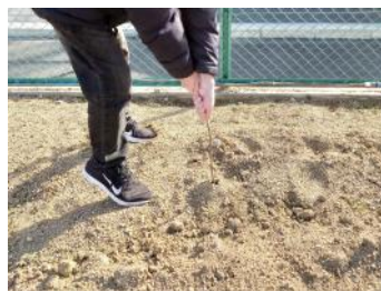
引っこ・・・抜けない!