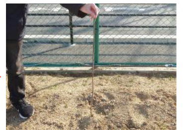
腰の高さまで伸びてる

冬を迎えると葉が枯れ落ち始めました、おそらく春を迎える準備に入ったのでしょうか。ですが、春に育てる作物の会議を行ったところ、畝全面を使用して、じゃがいも、レタス、スナップエンドウ、枝豆を育てる事が決定したので、調査も兼ねてメンバーたちと引っこ抜きに畑にむかいました。