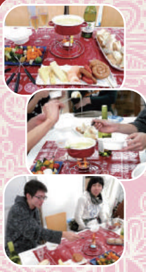
ヨダレフキナサイヨ

新年会を行いました。今年は二つのテーマに沿って二チームに分かれての実施です。チーズフォンデュチームのテーマは「フリースタ映え」。誰もインスタとかしてないけど頑張りました。今回の企画が決まってから、気になったのでチーズについてちよっと勉強してみました。原材料や菌種、火入れの有無、熟成期間や含水量などで様々な種類に分かれていることがわかりました。元々、フォンデュは固くなってしまったパンをどうにかして美味しく食べるための知恵らしく、原点に立ち返ったフォンデュを目指しました。そのためチーズに拘り、本場感のあるエメンタールとグリュイエールを求めて、休みの日にあちこち探しまわりました。 エメンタールは木の実のような独特の香りとマイルドな口当たりで、グリュイエールは癖が無くナッツのようなコクがあるチーズです。どちらもそのまま食べても美味しいので、フォンデュにすれば間違いなしです。 まずは下準備から始めます。パンは一口大に切り分けて、野菜は適当に切ってから茹でます。ここまではとても簡単でしたが、チーズをワインで溶かす作業が難しく、分量の感覚が今一つわからなくてワインを入れすぎてしまったのとチーズが分離して溶け切らなかつたのが心残りです。 写真を撮る時に盛り付けをすこく拘ってカラフルでゴージャスにして撮りました。 写真を撮るのが終わってからもみんなで食べ始めました。最初(食べ始め)はすごく美味しいチーズフォンデュを食べている所で、火力が落ちてきたので固形燃料を追加したら、誤って火柱が上がってしまい、ちよっとびっくりした。その結果チーズが固まって焦げてしまい、残念ながらチーズフォンデュは継続不能となり即終了。燃料はまだ燃えていたので、そのまま直火焼き大会になりました。ウインナーやパン、野菜を焼いて食べたら、意外と美味しかった。